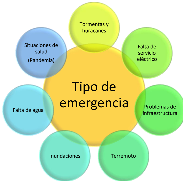
Figura 1: Ejemplo de posibles emergencias o desastres